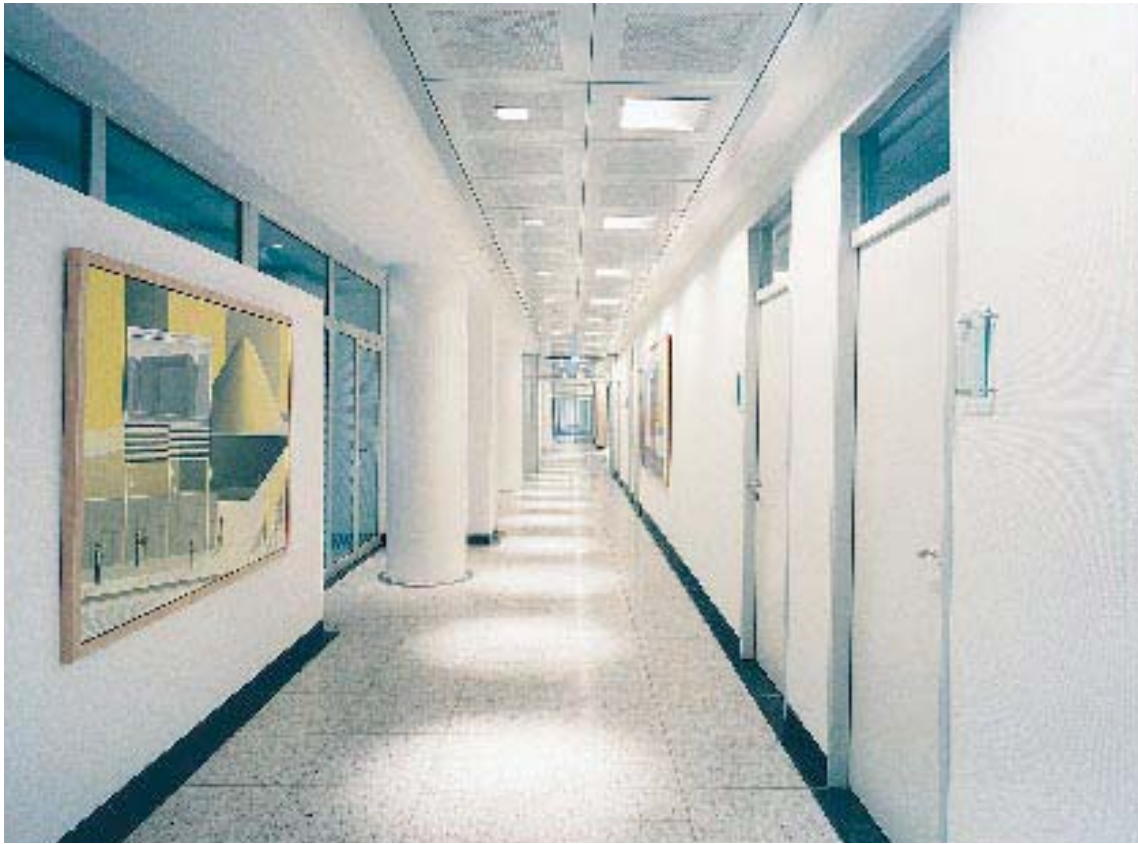
Flur am Kundenzentrum im Erdgeschoß Hansaring 40-46