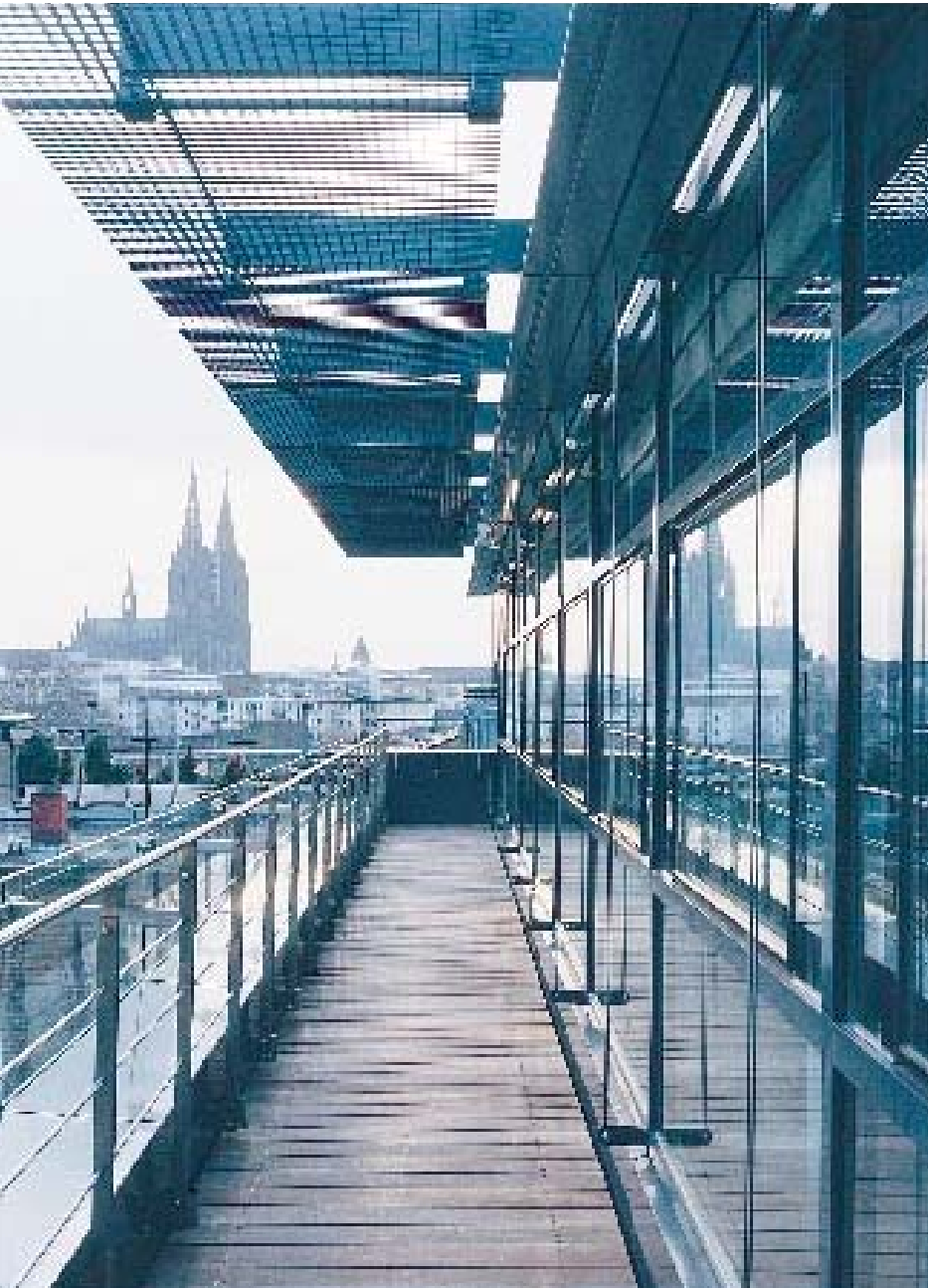
Balkonterrasse im sechsten Obergeschoß an der Adolf-Fischer-Straße mit Blick auf den Kölner Dom

Rund 5.580 Quadratmeter Nutzfläche sind in dem neuen siebengeschossigen Gebäudekomplex entstanden – insgesamt 120 neue Büroräume, die 250 bis 270 Mitarbeitern Platz bieten. Da gerade an Besprechungs- und Besucherräumen ein Mangel herrschte, wurde direkt neben dem Eingang am Hansaring ein Besucherzentrum eingerichtet.